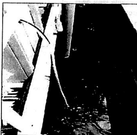
Fotografía 1: Punto de Muestreo